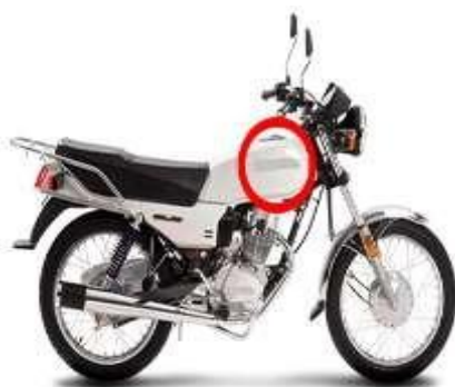
VÁLVULA/TANQUE DE SUMINISTRO DE COMBUSTIBLE

Cambie a punto muerto antes de detenerse para evitar una frenada brusca o que se caliente el motor.