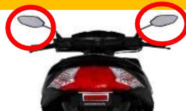
ESPEJOS RETROVISORES LATERALES