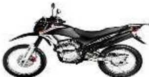
TRIAL, MOTOCROSS, ENDURO

Vehículo pesado, diseñado con características específicas para recorrer largas distancias.