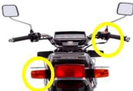
INTERRUPTOR DE SEÑAL DE GIRO

Para apagar el vehículo habrá que girar el interruptor de corte del motor a la posición de apagado con el pulgar derecho.