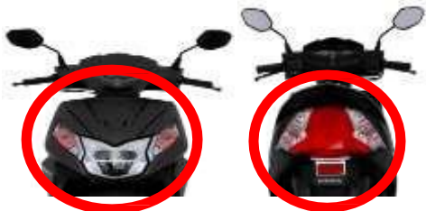
FARO DELANTERO, POSTERIOR, DIRECCIONALES Y REFLEJANTES