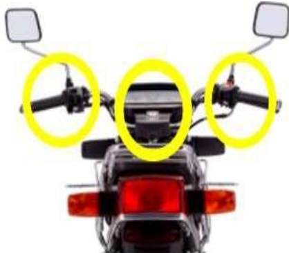
INTERRUPTOR/BOTÓN DE ENCENDIDO.

Su función es encender el vehículo teniendo tres posiciones: encendido, apagado y neutral.