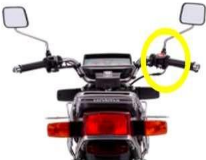
INTERRUPTOR DE CORTE DEL MOTOR.

Para encender el vehículo habrá que colocar la llave y girar el interruptor de encendido a la posición de encendido, si se alumbran las luces indicadoras es que la función ha sido correcta.