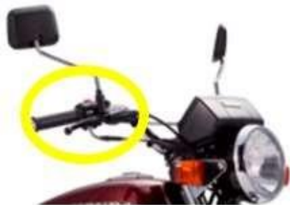
FRENOS/DISMINUCIÓN DE LA VELOCIDAD

Para disminuir la velocidad habrá que hacer presión en el pedal de freno lentamente hasta que el vehículo se detenga, sin embargo, hay motocicletas que requieren apretar la palanca de embrague; para tener estabilidad hay que centrar el manubrio, así como tocar el piso con el pie izquierdo, para tener mejor control del pedal de freno.