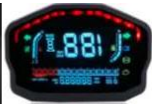
BOTÓN DE ENCENDIDO, VELOCÍMETRO, ODÓMETRO Y TACÓMETRO