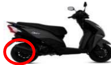
SILENCIADOR EN EL SISTEMA DE ESCAPE